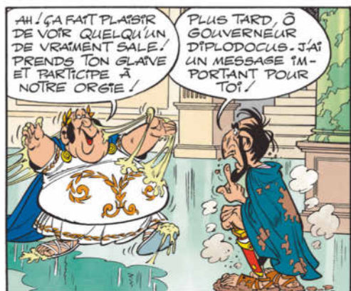
ASTERIX® - OBELIX® - IDEFIX® / ©2020 LES ÉDITIONS ALBERT RENÉ / GOSCINNY - UDERZO