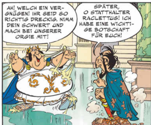
Extrait de l'album Astérix chez les Helvètes