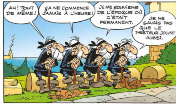
ASTERIX®-OBELIX®-IDEFIX® / ©2024 LES ÉDITIONS ALBERT RENÉ/GOSCINNY - UDERZO