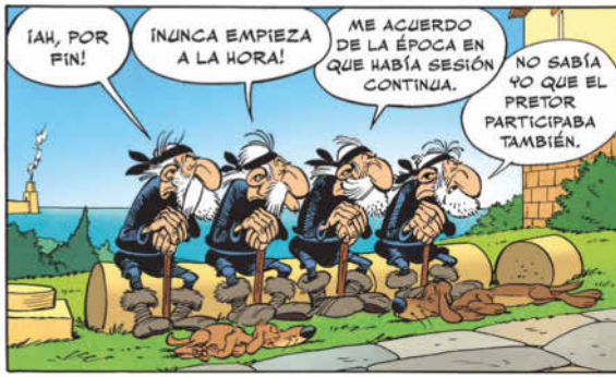
Extrait de l'album Astérix en Corse