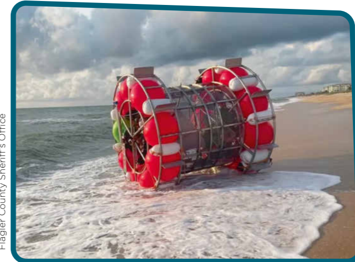
Flagler County Sheriff's Office

In late August, a man tried to cross the Atlantic Ocean in this giant hamster wheel. He left from Florida to get to London. He was caught by the coast guard. He has tried 3 similar voyages before.