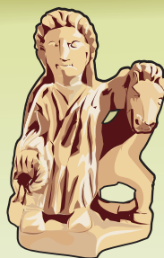
Ésus , le dieu de la Terre et de la Forêt.