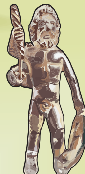
Taranis , le dieu du Ciel, du Feu et de la